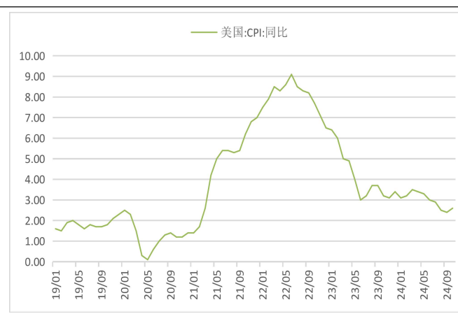
图表 2：美国 CPI 同比