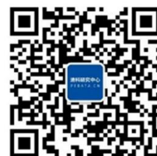
清科研究微信公众号