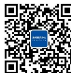
清科研究微信公众号