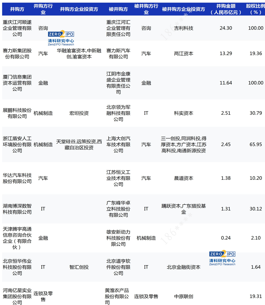
表 5 2024 年 8 月 VC/PE 支持并购部分案例