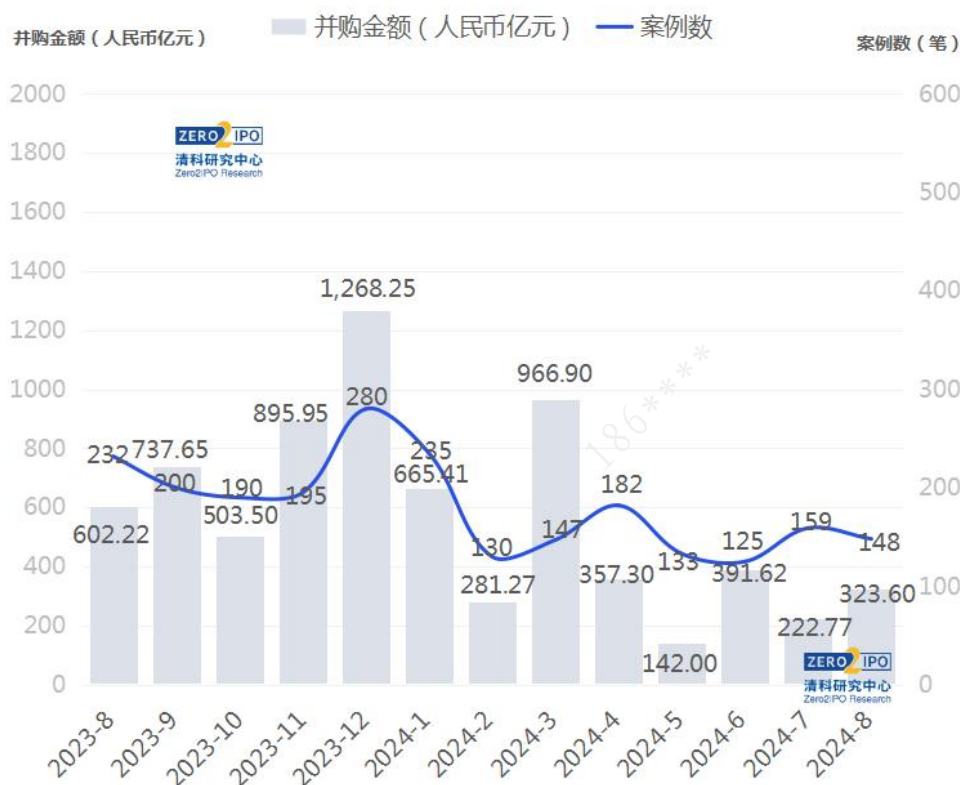
图 1 2023年8月至2024年8月并购市场交易趋势图

根据清科创业（01945.HK）旗下清科研究中心数据，2024年8月中国并购市场共完成148笔并购交易，数量环比下降6.9%，同比下降36.2%。其中披露金额的有101笔，交易总金额约为323.60亿人民币，环比上升45.3%，同比下降46.3%。