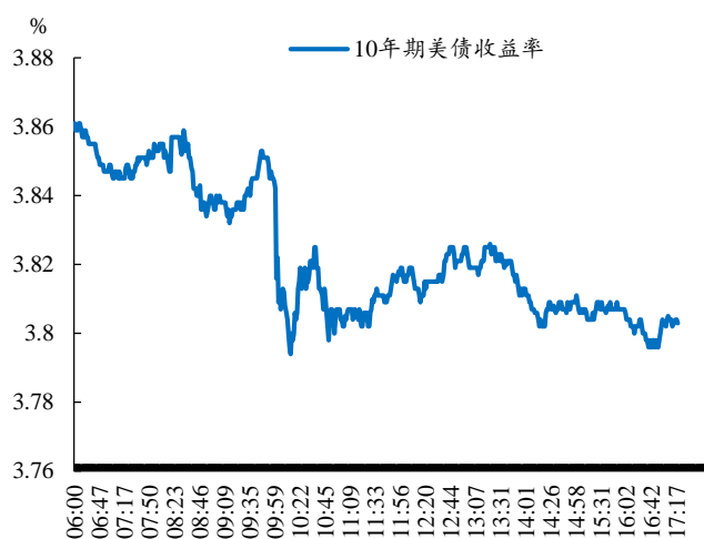
附图2. 10年期美债收益率收跌