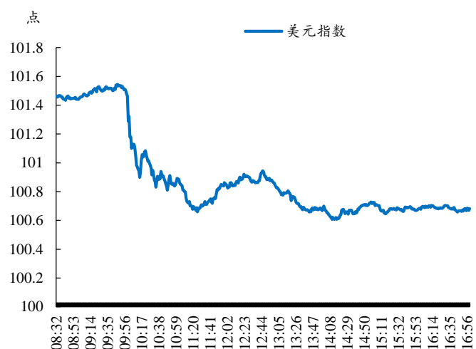
附图3. 美元指数下跌